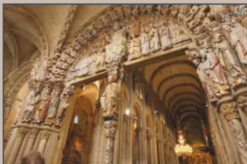
Pórtico de la Gloria en la Catedral de Santiago