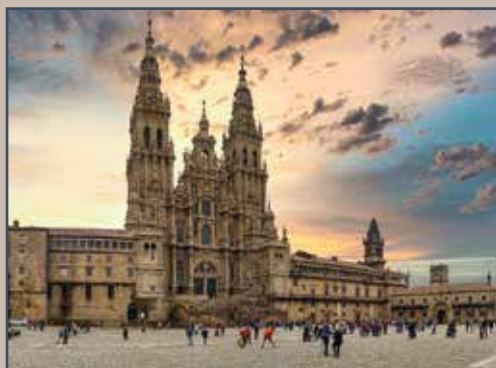
Catedral de Santiago

Tu Camino, si lo empiezas en Ourense, tiene principio y final en un Pórtico. Cien kilómetros separan los dos Pórticos más famosos de Galicia , o lo que es lo mismo, cien kilómetros separan el Paraíso, en Ourense, de la Gloria, en Santiago .