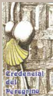
Credencial del Peregrino

‘Todo camino empieza con un primer paso’, decía el filósofo chino Lao-Tse, pero aquí, además, empieza con la Credencial del Peregrino si quieres obtener la Compostela al llegar a Santiago. La asociación pone a tu disposición la Credencial en la que deben reflejarse los sellos de los lugares por los que pasas, y con la que te identificarás en la Oficina Internacional del Peregrino para conseguir la Compostela, el documento que certifica que has completado el Camino.