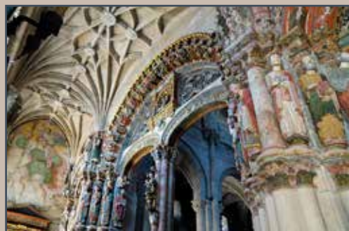
Pórtico del Paraíso en la Catedral de Ourense

El Pórtico del Paraíso de la Catedral de Ourense es uno de los conjuntos monumentales más destacados del templo , y toma su influencia del que el Maestro Mateo erige en Santiago, aunque el ourensano es posterior (siglo XIII). La última restauración, finalizada en 2013, sacó a la luz una espectacular policromía en las figuras de los apóstoles y los profetas .